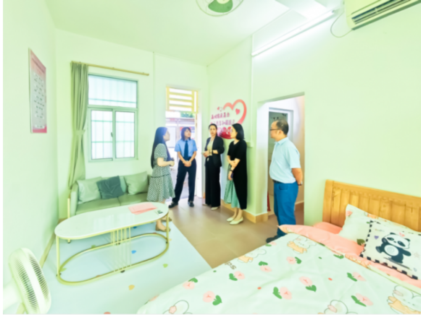
中山一区检现场评估反家暴庇护所现场。